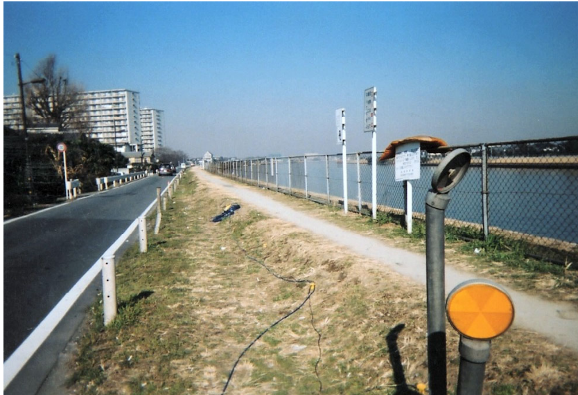
中川河岸での受振器とケーブル(RP.170付近).