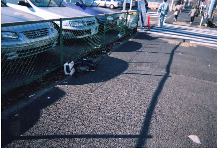
街中でのケーブルとRSU