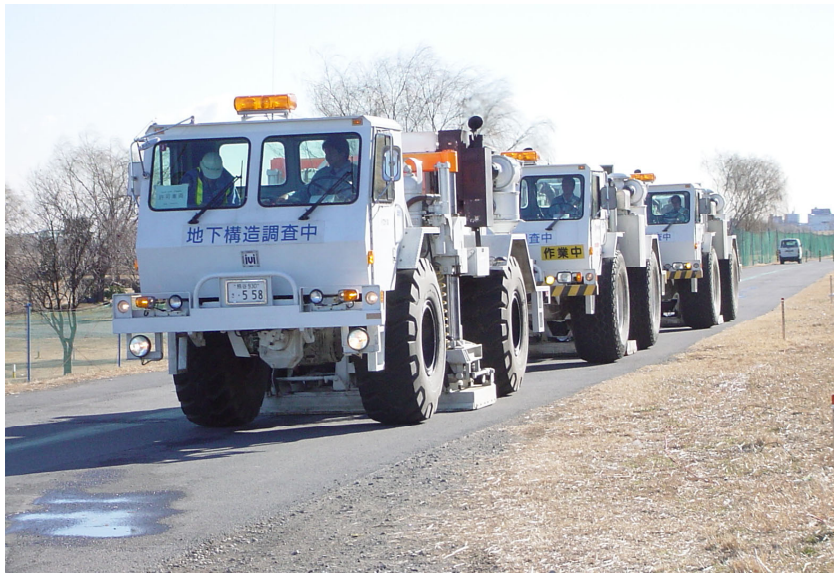
荒川河川敷での発震(VP.816)