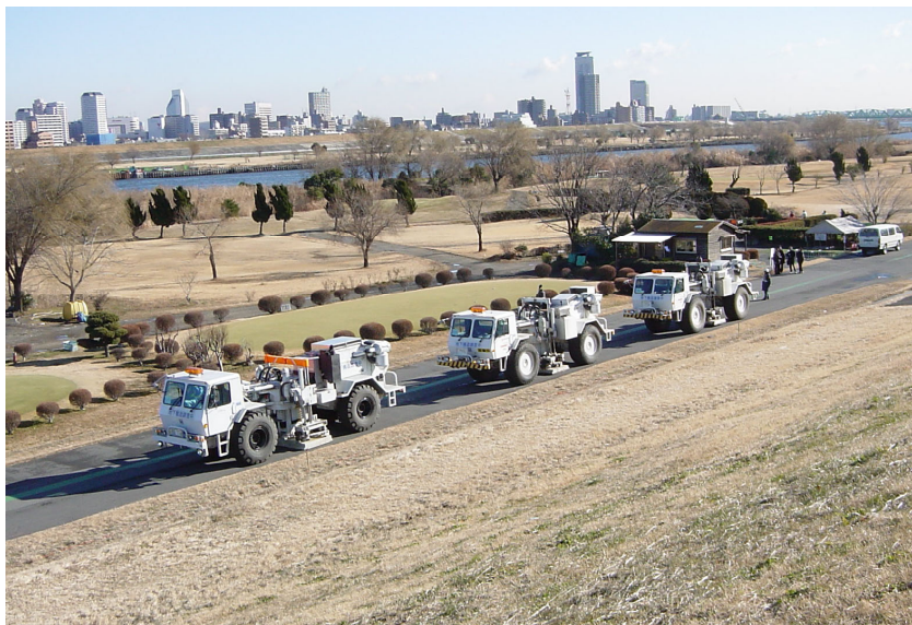
荒川河川敷での発震(VP.816)遠景