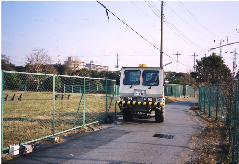
ミニバイブ発震作業(VP.40付近)