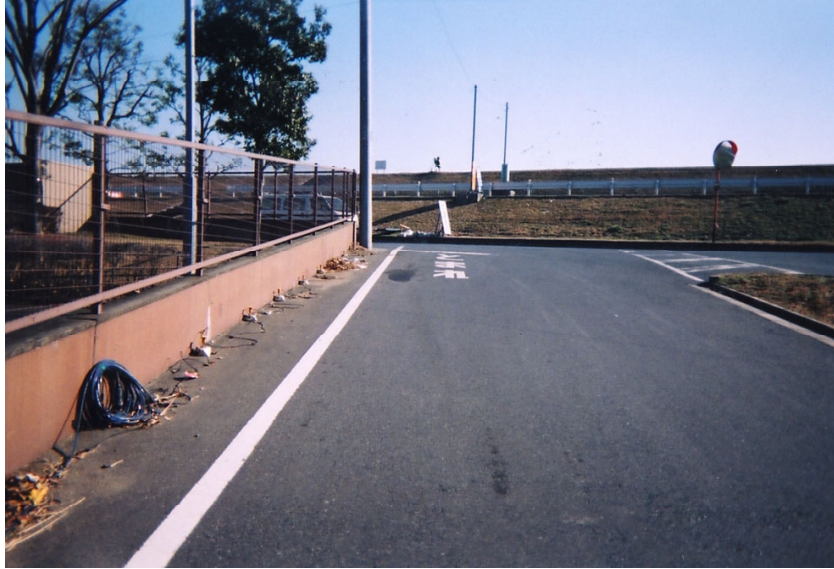
測線東端での受振器とケーブル(RP.1)