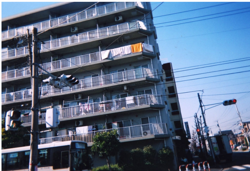
信号柱によるケーブルの共架