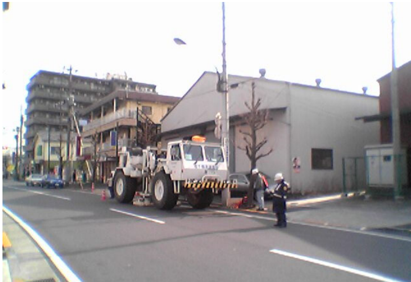
街中での発震(VP.510付近)