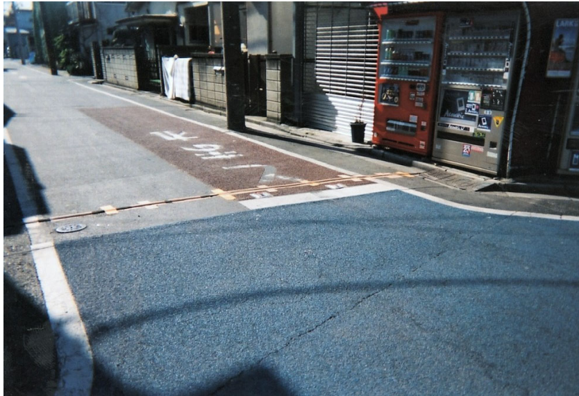
街中でのケーブルの道路横断