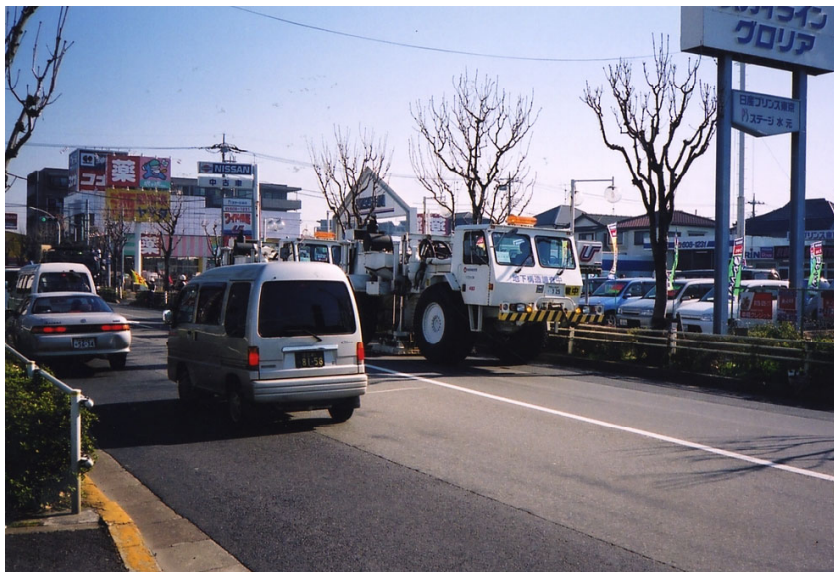
街中での発震(VP.550付近)