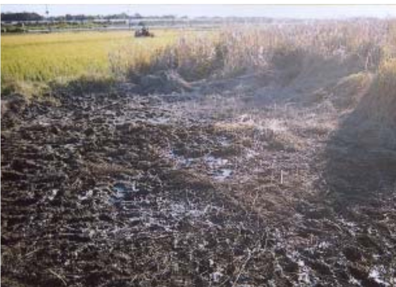
市原 - 復旧後の状況