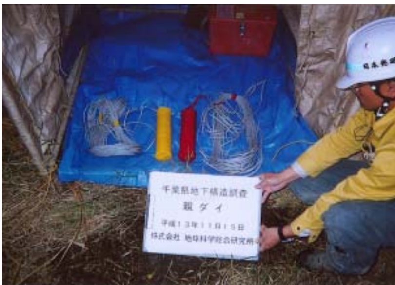
市原 - 親ダイ