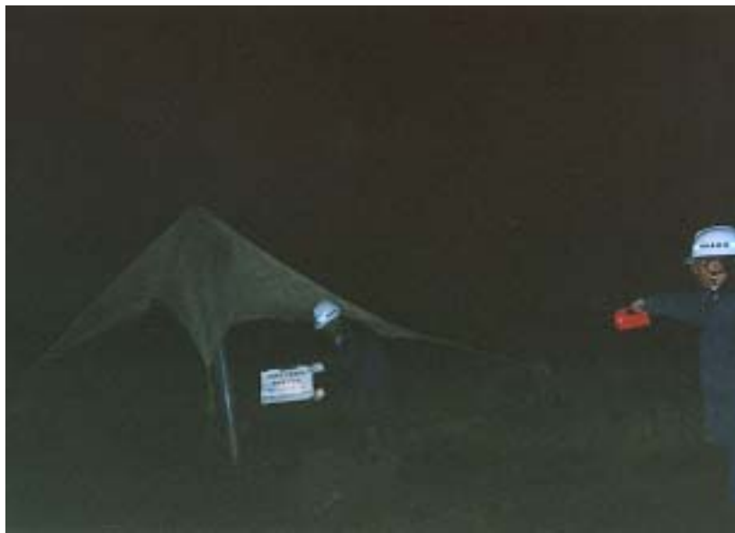
富津 - 発破直後の状況