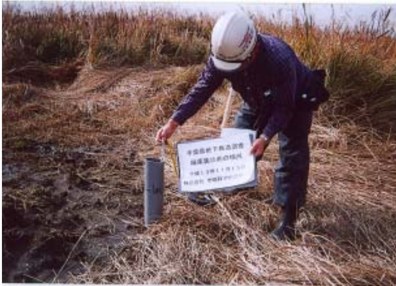
市原 - 爆薬装填前の検尺