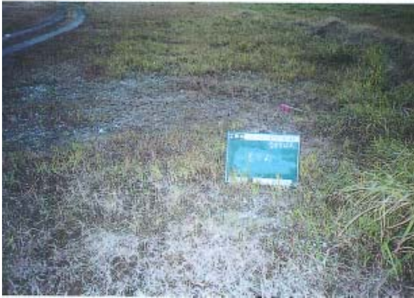
富津 - 着工前の状況