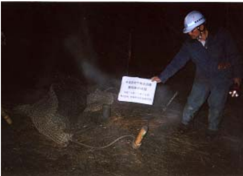
市原 - 発破直後の状況