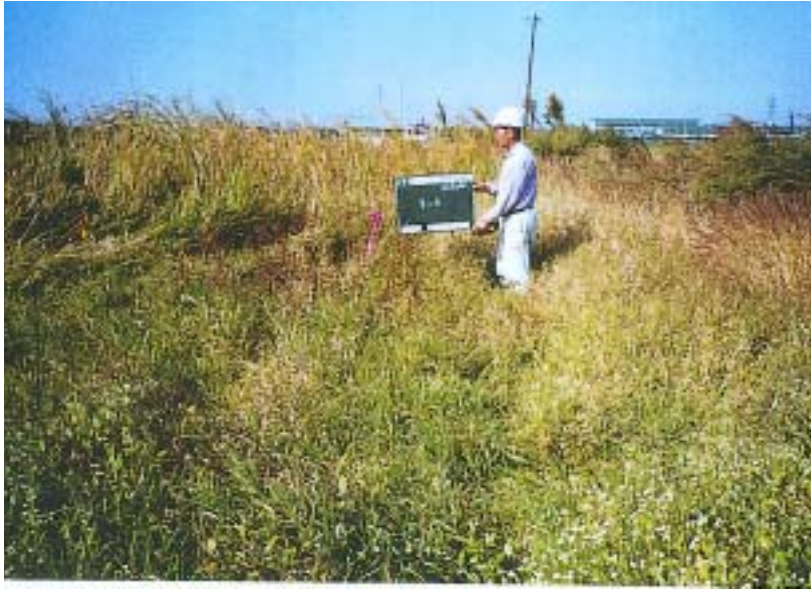
市原 - 着工前