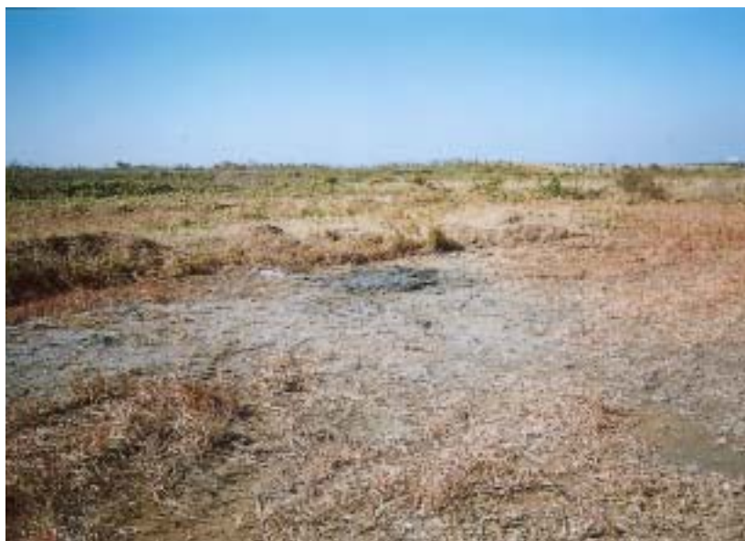
富津 - 復旧後の状況