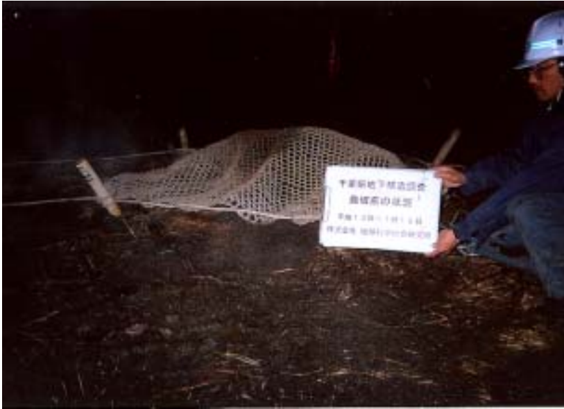
市原 - 発破直前の状況