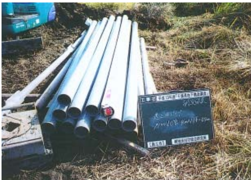
市原 - 挿入管の検収