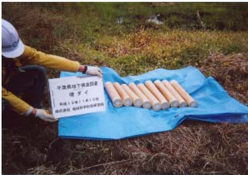
市原 - 増ダイ