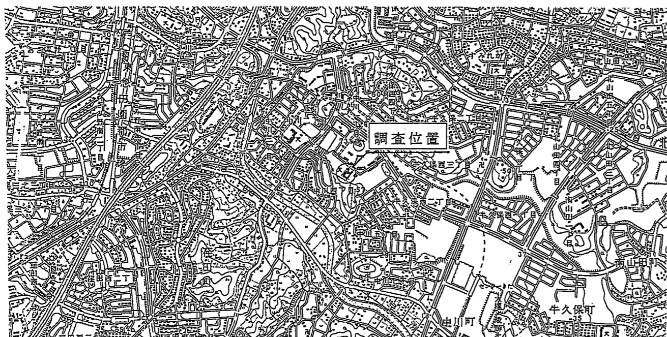
調査位置図 (縮尺 s=1:25,000)