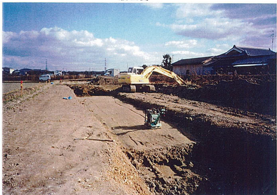
ピット部埋め戻し