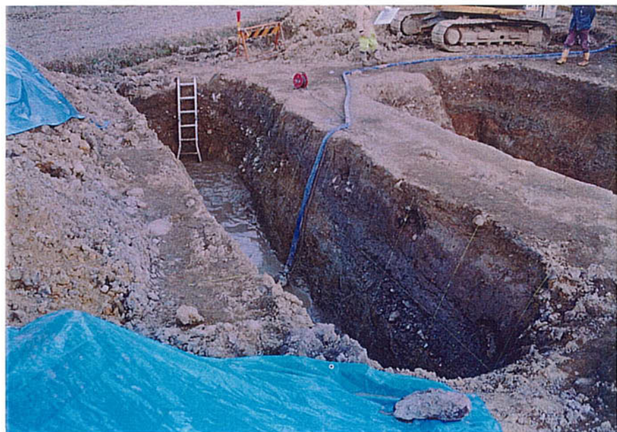
トレンチ全景 (三次掘削)