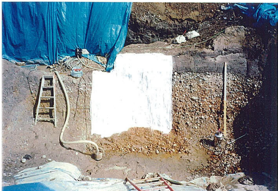
はぎ取り台布張り付け