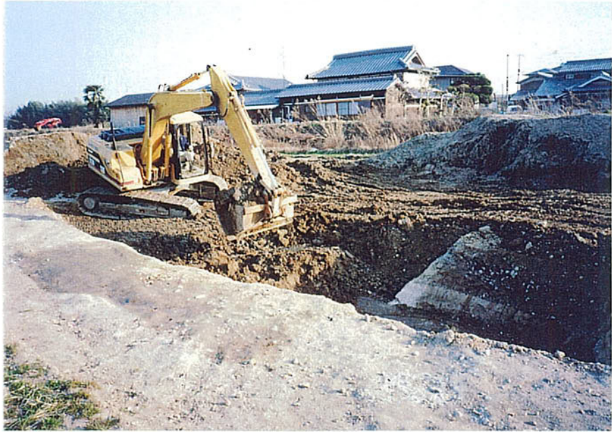
トレンチ部埋め戻し