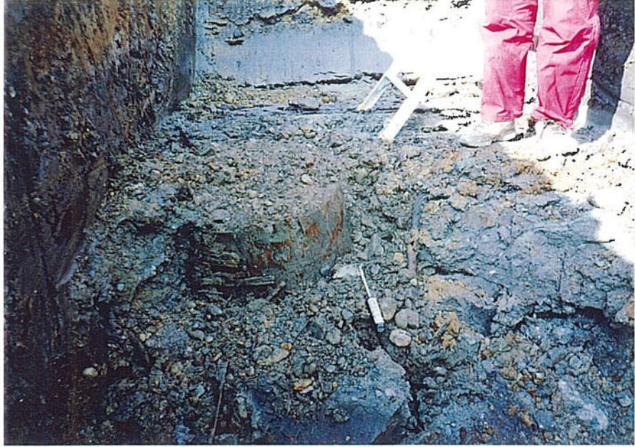
ピット部井戸の遺構出現