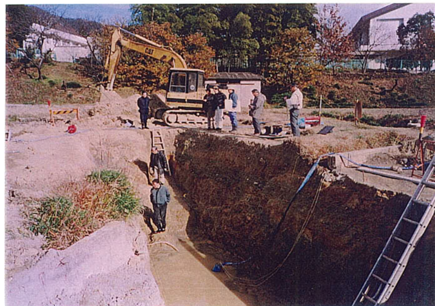
活断層調査委員会現地視察