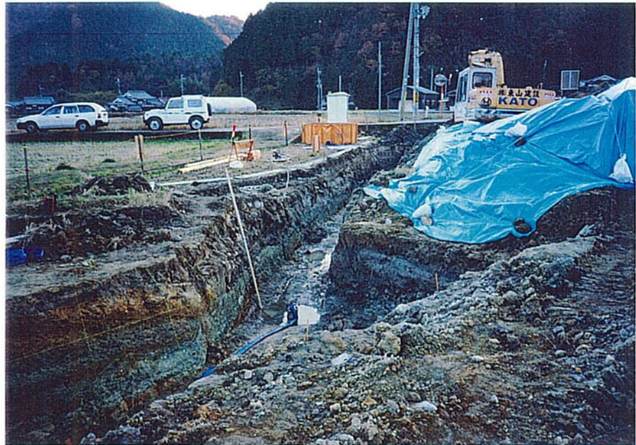
トレンチ全景 (二次掘削)