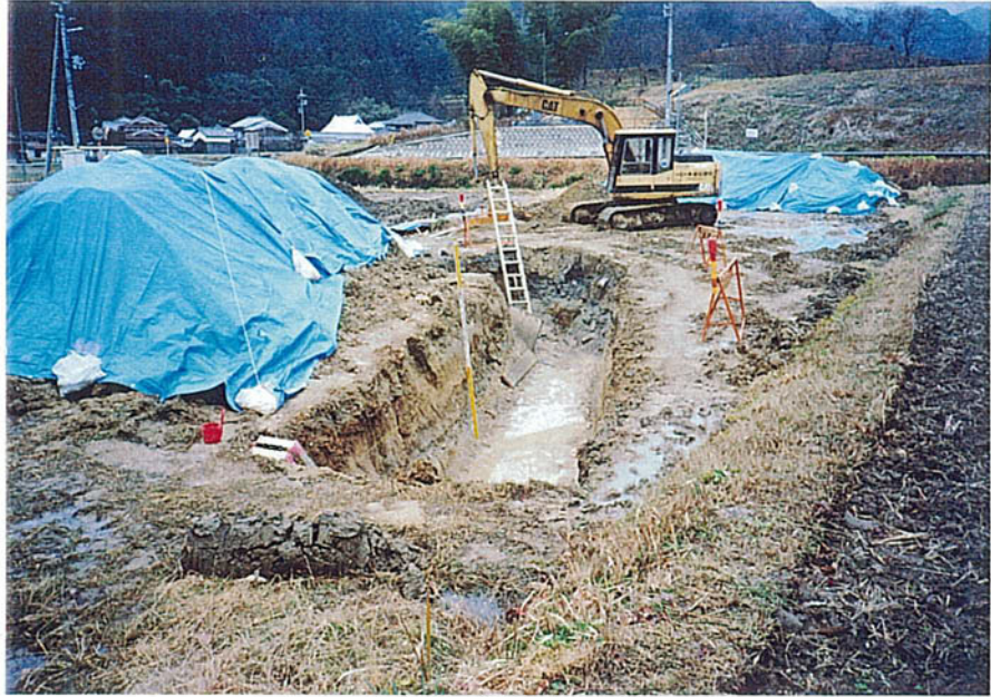
トレンチ全景（四次掘削）