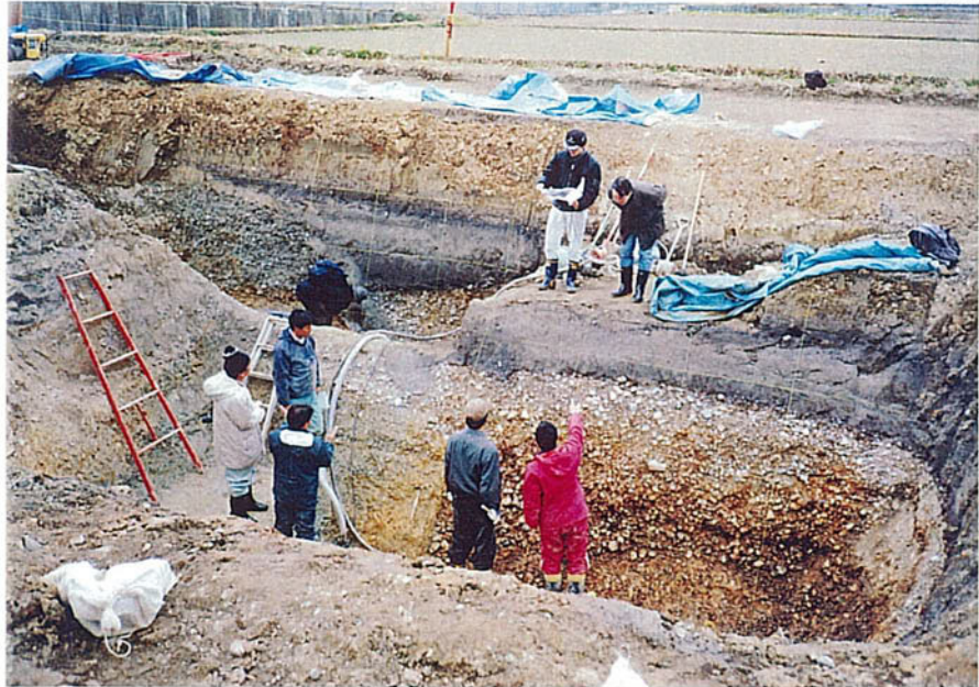
活断層調査委員会現地視察