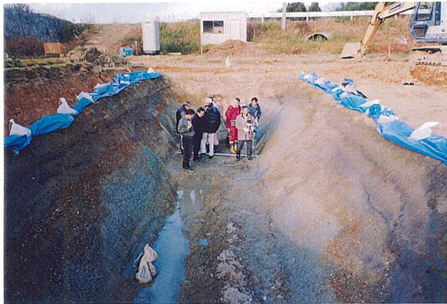
活断層調査委員現地視察