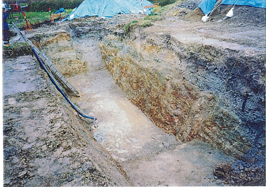
トレンチ全景 (一次掘削)