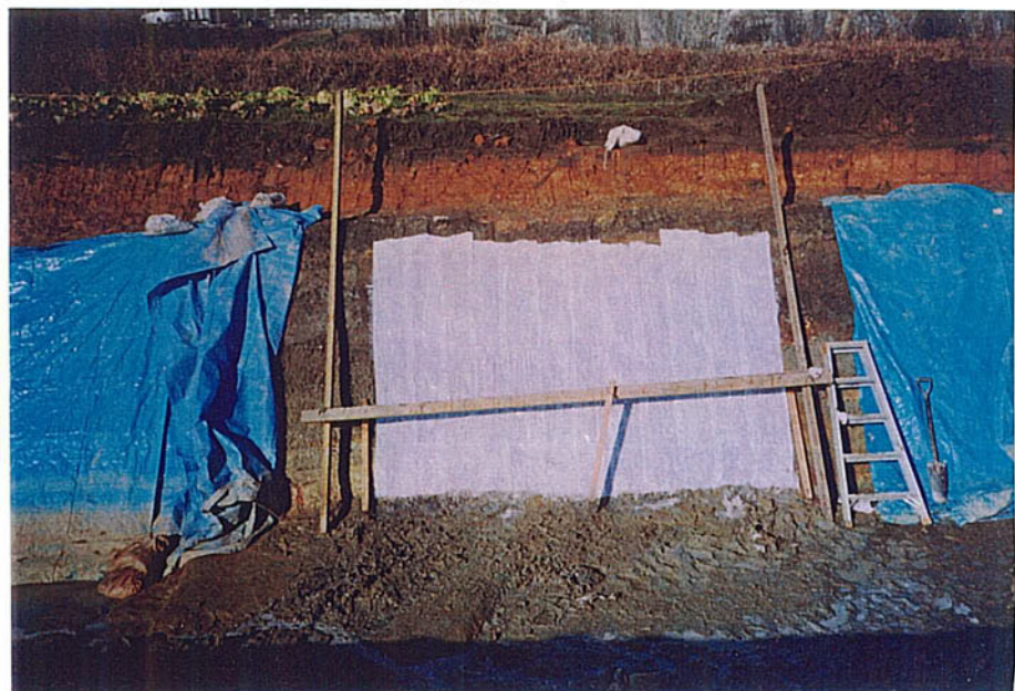
はぎ取り台布張り付け